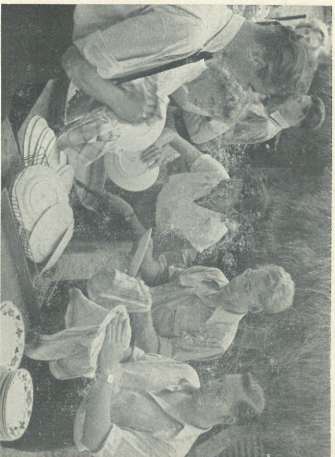
Met deze foto won de heer Meester, afd. Codering, de eerste prijs in de afdeling gevorderden. Niemand zal kunnen ontkennen dat de fotograaf met deze foto de „vacantie” bijzonder goed in beeld heeft gebracht.

Bij het uitschrijven van deze wedstrijd was de nadruk speciaal op het onderwerp „Vacantie” gelegd. Veel opnamen waren typische natuurfoto's, die in het geheel uitdrukking aan het begrip vacantie gaven. Het gevolg hiervan was, dat een aantal troostprijzen niet kon worden toegekend. Het toekennen van de eerste prijs was voor de jury